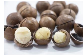
マカデミアナッツ