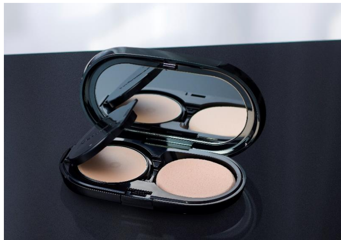
商品名：セルグレース ベースイン パクト ファンデーション (全8色)